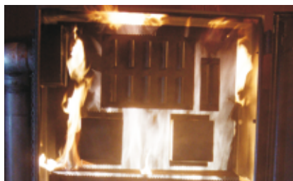
Feu d'armoire électrique