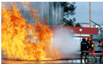
Feu de pont/nappe