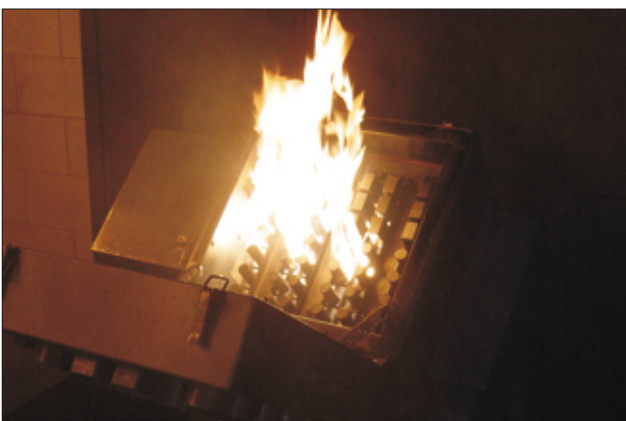
Feu de station de radar