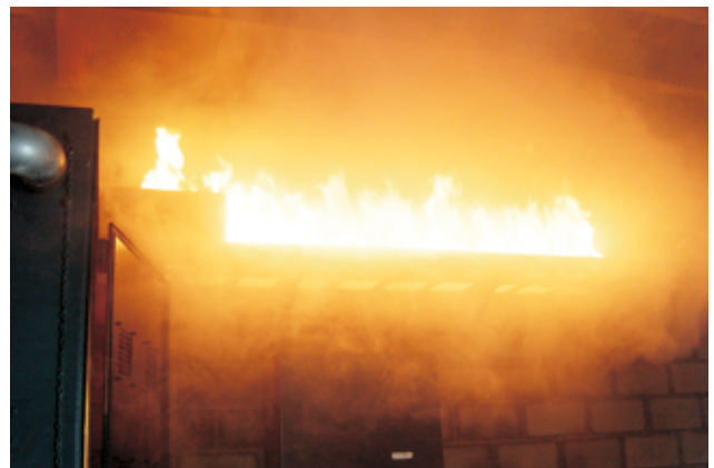
Feu de chemin de câbles