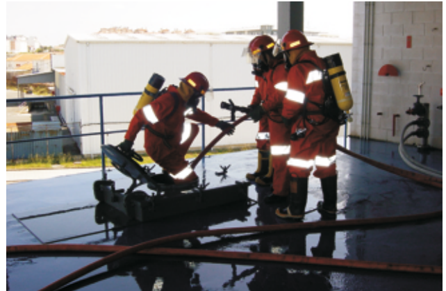
Entrée dans un hublot