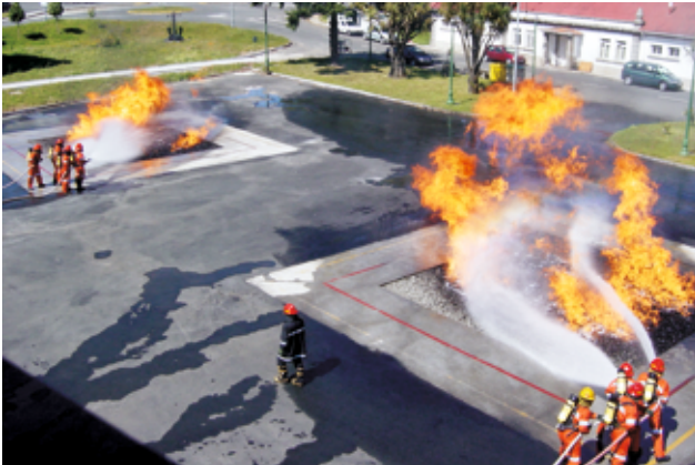
Les deux feux de pont sont activée