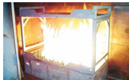
Feu de couchette