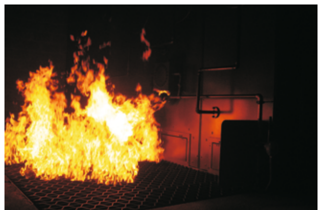
Feu de cale/sous-parquet