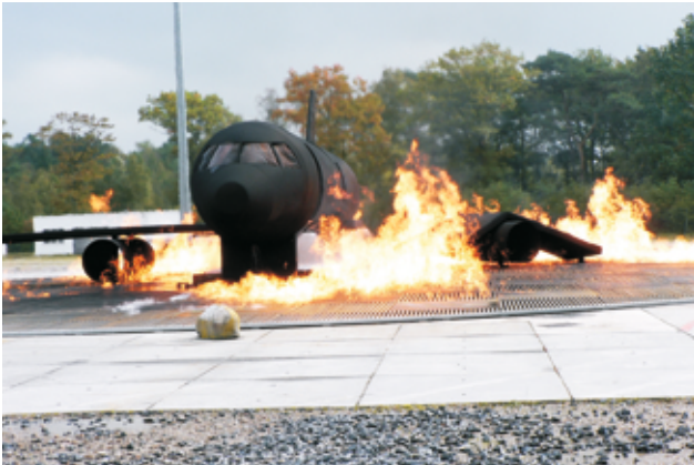
Fluzeugattrappe mit geborstener Tragfläche