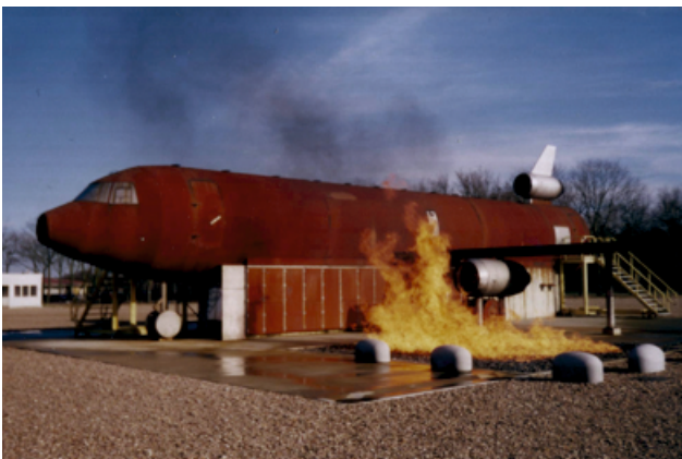
B737 Flugzeugtrainer mit Flächenbrand