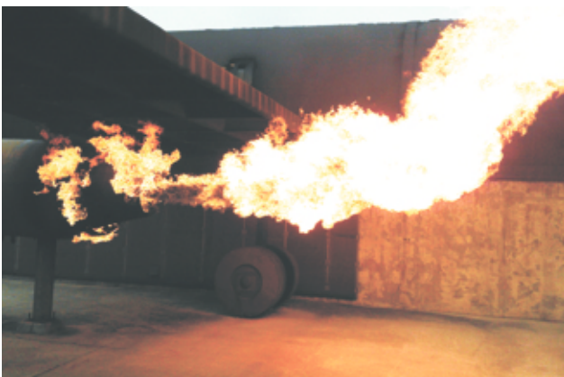
Triebwerksbrand "Hot Flash"