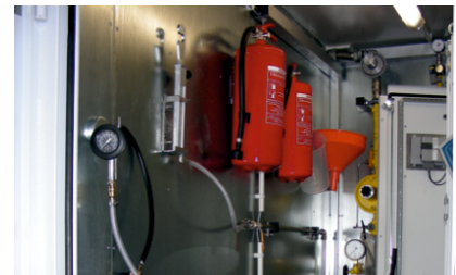
Füllstation für Feuerlöscher